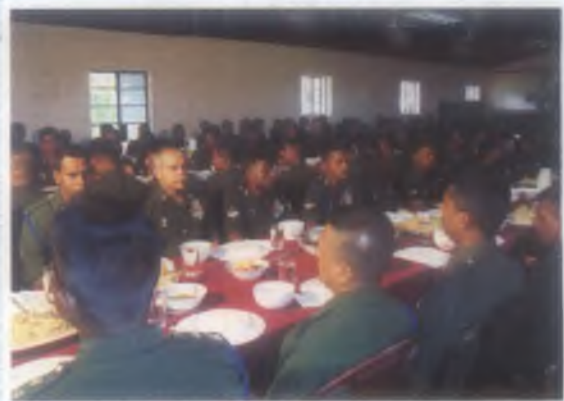
සංඥා මුලික වැඩපල 09 වන සංවත්සරය වෙනුවෙන් පැවැත්වූ සියළු නිල දිවා තෝරන සංග්‍රහය.