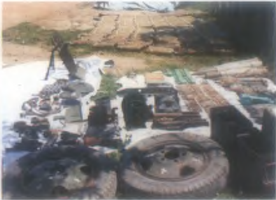
සෝදිසි මෙහෙයුම් වලදී සොයාගන්නා ලද අවි පතොරම් හා වෙඩි දෑ වලින් කොටසක්.