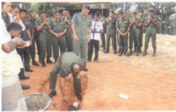
2009.11.11 දින බළකාධිපති විසින් සංඥා පාසලෙහි නිලධාරී නිවේශනය ඉදිරිපත් සඳහා මුල්ගල තැබීම.