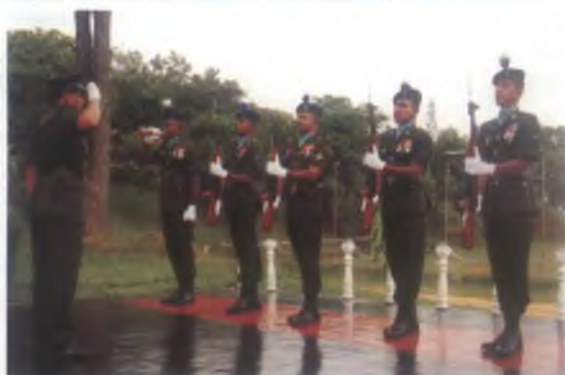
සංඥා මුලික වැඩපල 09 වන සංවත්සරය වෙනුවෙන් සේනාධිපාය වෙත පිරිනමන ලද සම්මාන මුරය.