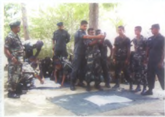
2 (සෙවි) ශ්‍රී ලංකා සංඥා බලකායේ නිල උසස් කිරීමේ හා වාර්ෂික පාඩමාලාවන් පවත්වාගෙන යනු ලබන ආකාරය