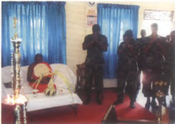
2009.05.13 දින අභ්‍යන්තර(ක) වැඩිහිටි ප්‍රදේශයේ ඒකකය ස්ථානගත කිරීම ප්‍රධාන කොමිෂනර් අභ්‍යන්තර නිලධාරී විසින් පැවැත්වූ ආරම්භ කිරීම.