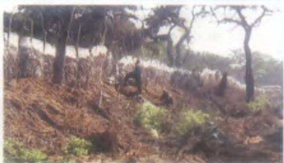
5 වන රෙජිමේන්තුව ශ්‍රී ලංකා සංඥා බලකායේ හට පිරිස් ස්ථානගත නවීකූල ඉදිරි ආරක්ෂක වළල්ල.