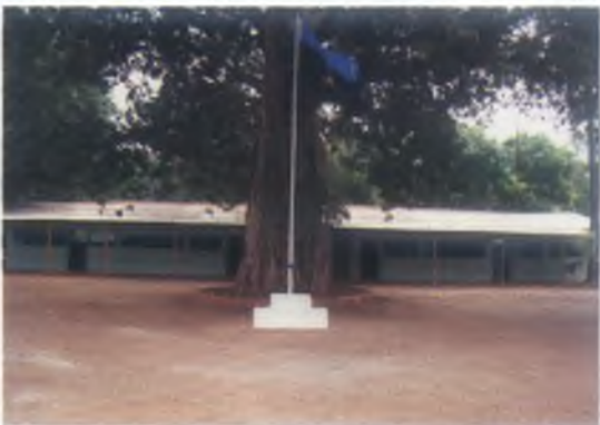
අභිතවයෙන් ඉදිකරන ලද හව 1 ශ්‍රී ලංසංඛ රෙජි මූලස්ථාන නොඩනැගිල්ල - ඔබ්බුසුඩාන්.