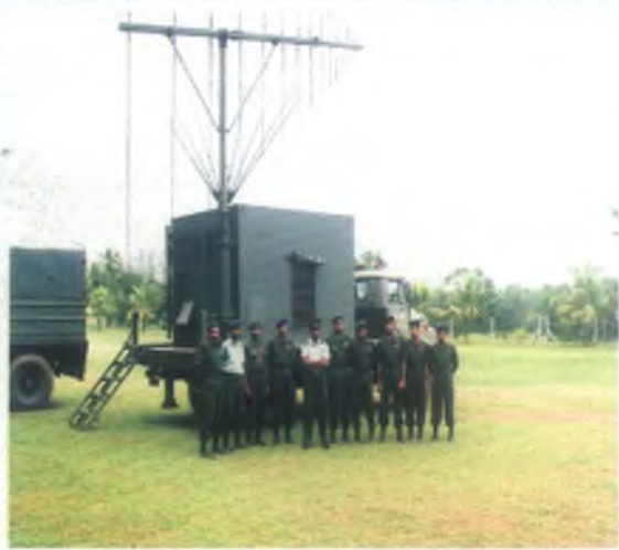
සතුරාගේ ඉදිරි ක්‍රියාකාරකම් ක්ෂණිකව ලබාදීම සඳහා ඉදිරි ක්‍රියාත්මක සැලසුම් කිරීමේදී මහඟු දායකත්වයක් ලබාදුන් ආසේමු (යා) විද්‍යුත් සංග්‍රාමික බලකායේ සෙතින් පිරිසක්. (වම විද්‍යුත් උපකරණ සමග)