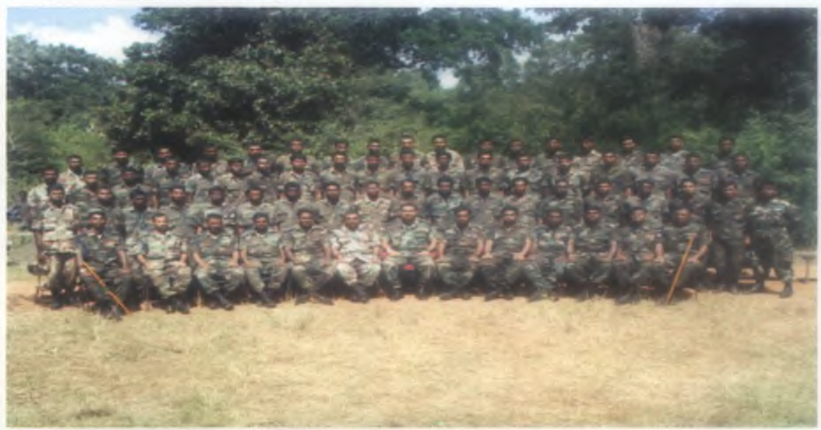
2009.03.26 වන දින 8 ශ්‍රී ලංකා ඒකක පළමු සංවර්ධනය තිමිත්තෙන් සියලු නිලධීන් සමූහ ආයාචනාපයකට පෙනී සිටි අයුරු.

2009.03.22 වන දින 8 ශ්‍රී ලංකා ඒකක පළමු සංවර්ධනය තිමිත්තෙන් ජයශ්‍රී මහ බෝධිය අසලදී බෝධිපුරාමය පිංකමක් පැවැත්වීම.