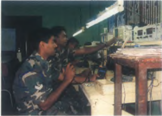
උතුරු ක්‍රියාත්මක රාජකාරියේ යෙදෙන සෙතින්ගේ ගුව යන්ත්‍ර/ප්‍රතිවිකාශන පද්ධති/අහස් කම්බි/දුරකථන/විදුලි කෝෂ ආදී සංඥා උපකරණ කඩිනමින් අවිත්වැබියා කරදි තම දායකත්වය ඉදිරි ක්‍රියාත්මකයන්ට ලබාදෙන සංඥා වැඩිපල සෙතින්.