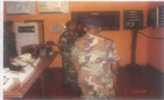
2009.09.07 සංඥා බළකායිපති විසින් දුරකථන සහ රැකැණි විද්‍යාගාරය නිරීක්ෂණය කිරීම.