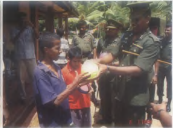
සංඥා මුලික වැඩපල 09 වන සංවත්සරය නිමිතිකොටගෙන අවස්සාවේදී මුද්ධිමය ආබාධිත නිවසකයේ තේවාසිකයින් හට දිවා ආහාරය සහ ඔවුන් වෙත තෑගි ප්‍රධානය කිරීම.