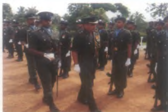
සංඥා මුලික වැඩපල 09 වන සංවත්සරය වෙනුවෙන් සේනාධිපාය වෙත පිරිනමන ලද සම්මාන පෙළපාලිය.