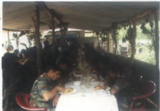
2009.03.26 වන දින 8 ශ්‍රී ලංකා ඒකක පළමු සංවර්ධනය තිමිත්තෙන් සියලු නිලධීන් දිවා භෝජන සංග්‍රහයක් පැවැත්වීම.