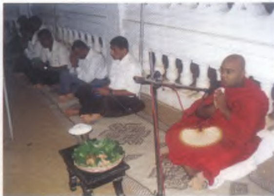
සංඥා මුලික වැඩපල 09 වන සංවත්සරය නිමිතිකොට ගෙන පුන බෝධිරාජාරාමයේදී සියළු නිළියින් එක්ව ඒකකයට සෙත්පතා පැවැත්වූ