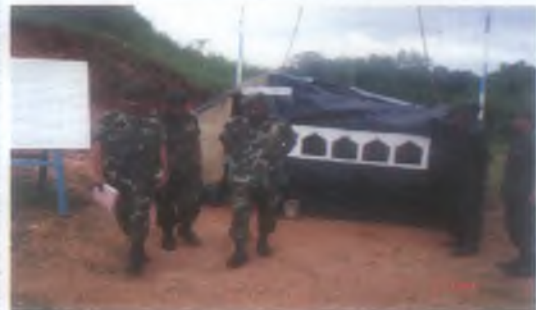
2009.09.07 සංඥා බළකායිපති විසින් කෝපුල් සිට සැරයන් දක්වා නිල උසස් කිරීමේ පාඨමාලාවේ වැඩිමත් ශ්‍රී ලංකා අනුපාතය හා සංඥා මධ්‍යස්ථාන ස්ථාපනය කිරීමේ අනුපාතය නිරීක්ෂණය කිරීම.