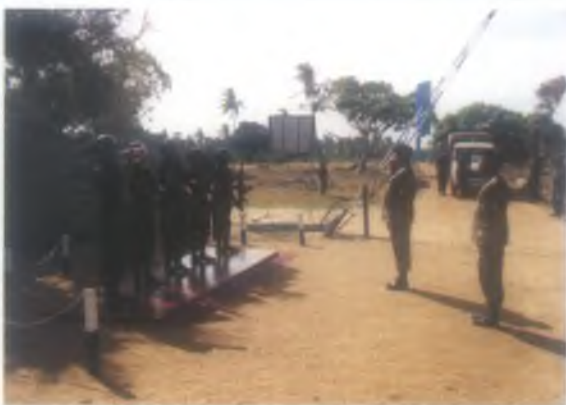
පළමු සංවත්සරය වෙනුවෙන් ඒකක අණදෙන නිළධාරී මේජර් විචල්කේ ජයරත්න පීඑස්සී හට පිරිනමන ලද සම්මාන මුරය.