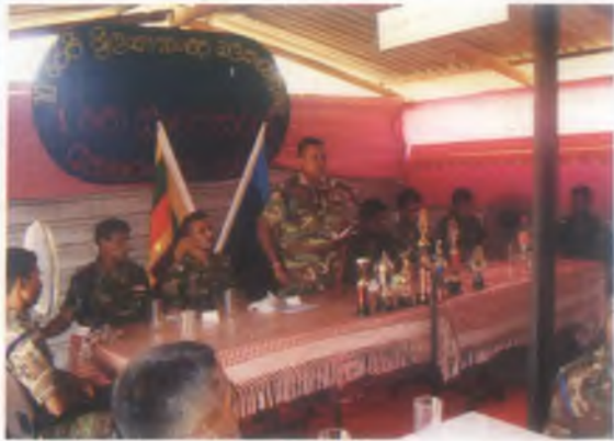
එකඟ සංවිත්සරය වෙනුවෙන් පැවති තිළිධාරි/සෙසුතිළ දිවා භෝජන සංග්‍රහයේදී අනුදෙන තිළිධාරි විසින් සියළු තිළියන් අමතමින්.