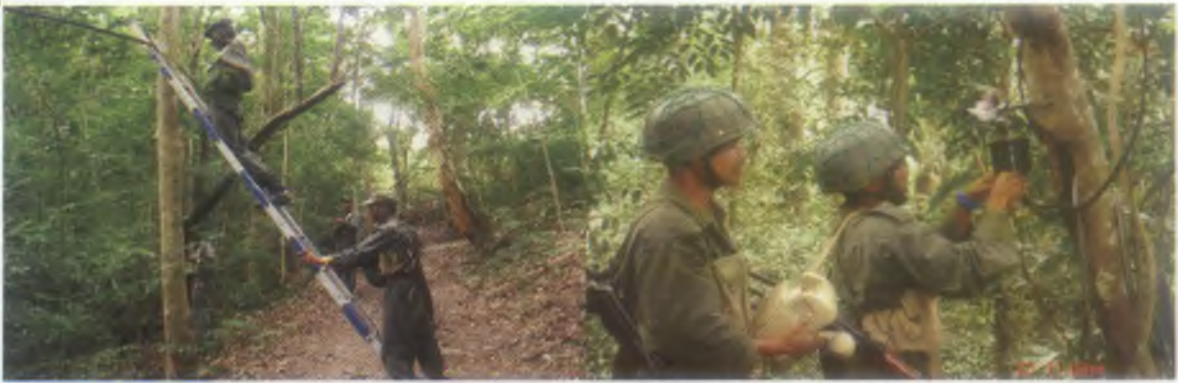
කෝපුල් සිට සැරයන් දක්වා තිල උසස් කිරීමේ පාඨමාලාවේ සෙබළුන් විසින් සෞත්‍ර දුරකථන සංඥා සම්බන්ධතාවයන් ස්ථාපනය කිරීම.