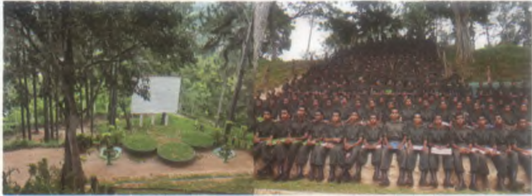
අළුතින් ඉදිකරන ලද විලිමහන් රංග පිඨය.

මේජර් විශ්වේශ්වරී පයවර්ධන පීච්ඨි ප්‍රධාන උපදේශක - සංඥා පාසල