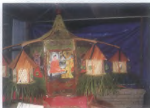
2009 වෙසක් උත්සවය සැමරීම.