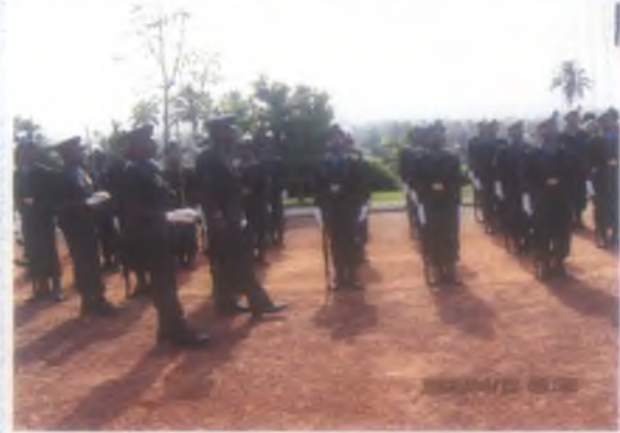
ඒකක දිනය නිමිත්තෙන් 2009.04.25 දින අභ්‍යන්තර නිලධාරී විසින් පැවැත්වූ සම්මාන ටොපොග්‍රැෆි.