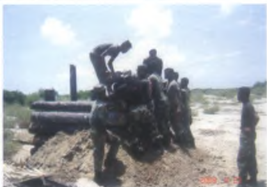
8 ශ්‍රී ලංකා තပ်ස පිරිස් යාපනය පුලුවේලි හි කලපුව ආශ්‍රිතව ඉදිරි ආරක්ෂක වළල්ල ඉදිකරමින්.