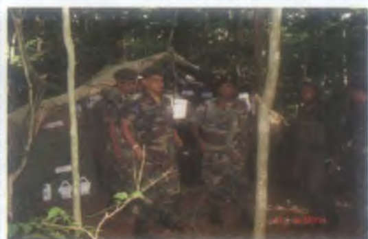
2009.09.11 දින ප්‍රධාන සංඥා නිලධාරී විසින් කෝපුල් සිට සැරයන් දක්වා නිල උසස් කිරීමේ පාඨමාලාවේ වන අනුපාතය නිරීක්ෂණය කිරීම.