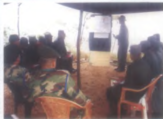
විශේෂ තරුණ නිලධාරී පාඨමාලාව (සියළු ඒකක) "Knuckles View" පිටත අභ්‍යාසයෙහි අවස්ථාවක්

මෙම තරුණ සංඥා නිලධාරී පාඨමාලාව විශේෂයෙන්ම සෙසු නිල අධිකාරියට පත් සියළු ඒකක නිලධාරීන් සඳහා පවත්වන අතර, මෙහිදී මෙම නිලධාරීන් හට හමුදා විෂය දැනුමට අමතරව බාහිර ක්‍රියාකාරකම් පිළිබඳව විශේෂ දැනුමක්ද මෙම පාඨමාලාව තුළින් ලබාදීමට ක්‍රියාකර ඇත. ඒ අනුව මෙම නිලධාරීන් සඳහා බාහිර ක්‍රියාකාරකම් වශයෙන් පහත සඳහන් විෂයන් හදුන්වාදී ඇත.