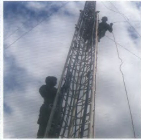
53 හා 55 සේනාංකය වෙත මුහුමාලෙයි ඉදිරි ආරක්‍ෂක විලේලෙන් ඉදිරියට සංඥා සම්බන්ධතා පැවැත්වීම සඳහා ඉදිකරන ලද සංඥා කුළුණ.