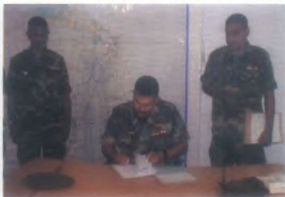
ලුහිතන් කාර්තල් බඩවිසිවන් වරකාගොඩ පිවිසි 1 ශ්‍රී ලංසංඛ 22 වෙනි අණදෙන නිලධාරී වශයෙන් 2009.09.03 දින අභිතවයෙන් වැඩ කාරගැනීම.