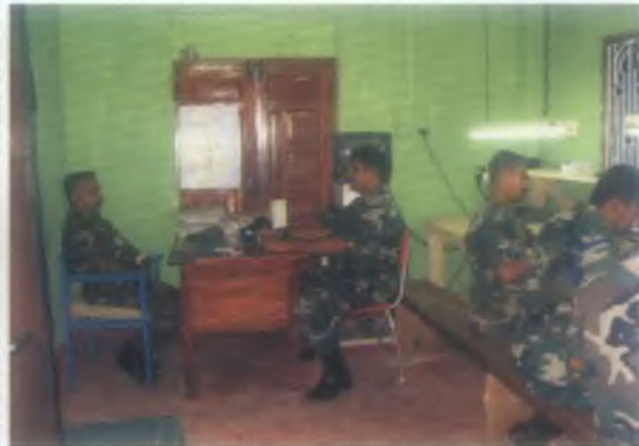
ආරක්‍ෂක සේනා මුලස්ථානය (යාපනය) හි ස්ථාපිත ඒකකය වෙතින් පාලනය වනු ලබන යෝධ සංඥා වැඩිපල.