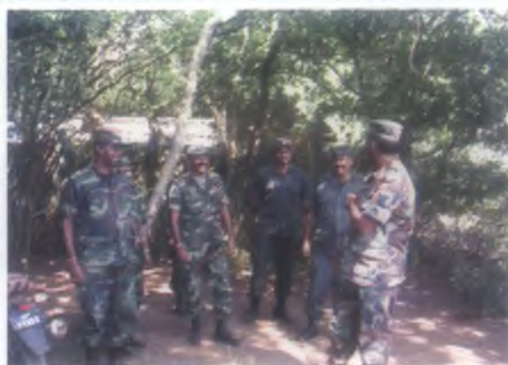
2009.02.16 වන දින ඉගුල්පායියකුලම් හිදී සංඥා බලකොටුව ගේ ඒකක සංචාරය.