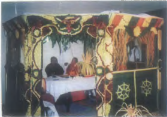
65 වෙනි සංවත්සරය වෙනුවෙන් පැවැත්වූ පිරිත් සජ්ඣායනය.

යෙදී සිටි දිවි පිළු හා ආබාධිත තත්වයට පත් සියළු විරෝධාර රක්‍ෂාවිරුවන් ඉතා කෘතඥවුවකව සිහිපත් කරන්නෙමු. 1 වන රෙජිමේන්තුව ශ්‍රී ලංකා සංඥා බලකාය අභිමානවත් ලෙස ශ්‍රී ලංකා ධරණි තලය තුල තව දුරටත් නිබඳව වැජඹෙන බව ඒකාන්තය.