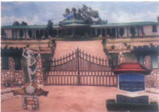
1 ශ්‍රී ලංසංඛ රෙජි මූලස්ථාන නොඩනැගිල්ල මිත්තේරයහිද පිහිටා තිබියදී.