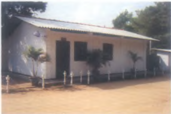
1 ශ්‍රී ලංසංඛ රෙජි මූලස්ථාන අණදෙන නිලධාරී කාර්යාලය - වැලිකන්දෙහි පිහිටා තිබියදී.