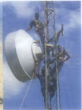
ක්‍රියාත්මකයන්ට සමගාමීව CDMA සහ ඩයලොක් සම්බන්ධතා ලබාදීමට කටයුතු කරමින් ප්‍රීලංසංඛ කාර්මික සෙහින් එම කාර්නයේ නිරතවෙමින්.