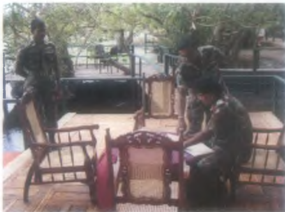
ඒකක සංචාරයේදී ප්‍රධාන සංඥා නිළධාරී බ්‍රිගේඩියර් එස්එස්පී සමරසිංහ ආර්එස්පී පීඑස්සී සමරු සටහනක් තබමින්.

ඒකකයේ පළමුවන සංවත්සරය සැමරීමට සුදානම් වන මේ මොහොතේ මව්බිමේ ඒකීය භාවය හා භෞමික අඛණ්ඩතාවය වෙනුවෙන් දිවිපිදු විරෝධාර සෙබළුන් ගෞරවයෙන් සිහිපත් කරමින් ඔවුන්ට අපරාමර නිවන් සුව අත්වේවායි පතන අතර තුවාල ලබා නේවාසිකව ප්‍රවීණ ලබන සියළු දෙනා හට ඉක්මන් සුවය ප්‍රාර්ථනය කරමු.