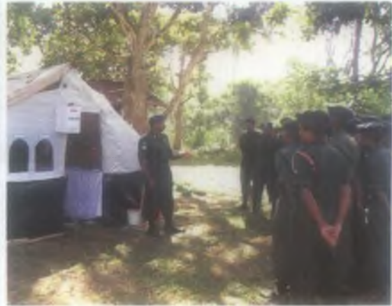
වෙනත් ඒකක සංඥා පාඨමාලා සිසුන් සඳහා ක්ෂේත්‍ර සංඥා මධ්‍යස්ථානයක් ස්ථාපිත කර ප්‍රායෝගික දැනුම ලබාදීම.

සංග්‍රාමික කටයුතු, දුරකථන මාර්ග හඬක්කුව, සංඥා මධ්‍යස්ථාන ක්‍රියා පිළිවෙත) මෙම වන අභ්‍යාස තුළින් ලබාදීමට ක්‍රියාකර ඇත.