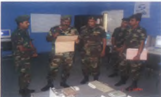
2009.09.07 සංඥා බළකායිපති විසින් පරීක්ෂණය විද්‍යාගාරය නිරීක්ෂණය කිරීම.