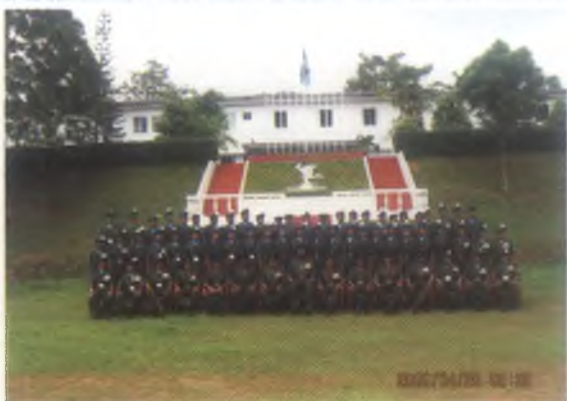
අභ්‍යන්තර නිලධාරී ඇතුළු නිලධාරී / සෙසු නිලධාරීන්ගේ සමුහ රැස්වීම.