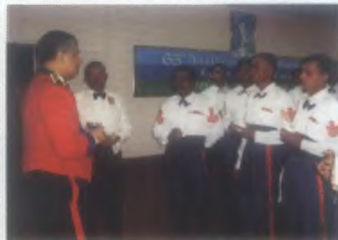
65 වන සංවත්සරය වෙනුවෙන් පැවැත්වූ බිති/සැරයන් නිවස්ස සාදය.