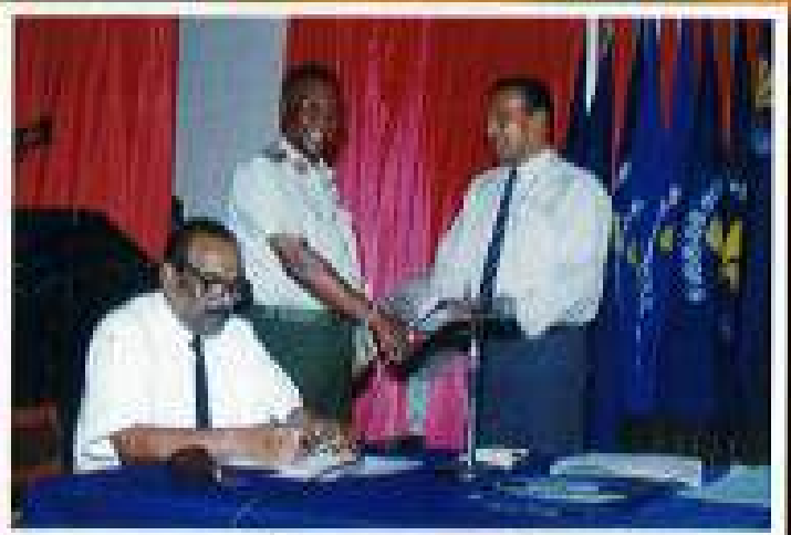
1998.01.25 වන දින පැවති රැස්වීමේදී රෙජිමේන්තු අධිපති විසින් පාබල හමුදයේ සහභාගී වෙම සාමාජික ශ්‍රී ලාංකීයයන් ලක්ෂ 3 ක පිරිනාසමකින් යුත් ප්‍රේමක පතක් ආරදෙන ලද අවස්ථාව.