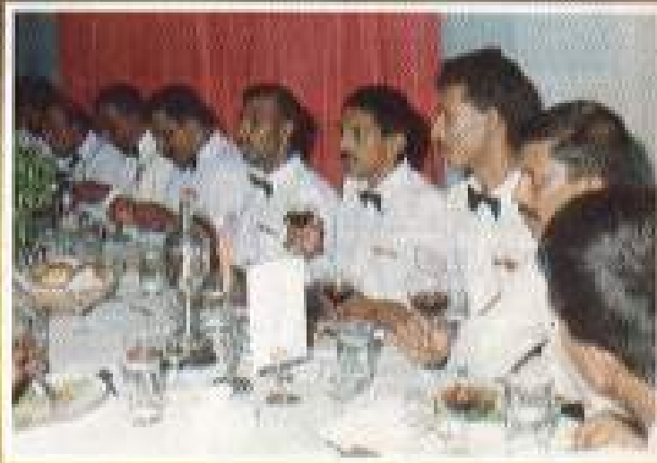
1998.03.08 දින දින රාත්‍රී හෝපන සංග්‍රහයේදී පිටුවහලා පානාගාරයේ පවත්වාගෙන යාමේ අවස්ථාවක්.