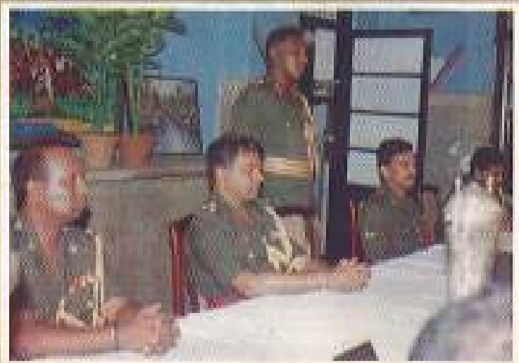
කෝපුල් සමාජ කාලාවේ පැවති රාත්‍රී භෝජන සංග්‍රහය නිමාවෙන් පසු රෙජිමේන්තු අධිකාරී, මුල්කාම විසින් සිංහල ජනපති ප්‍රසාද පවත්වන ලද ස්තූති කිරීම.