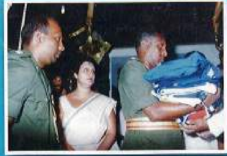
රෙජිමේන්තු අධිපති ඇතින් ඒකක බිජවලට සෙත් පැහීම සඳහා කතරගම දෙවාලය වෙත ආරදේශ ඇවිත්වා.