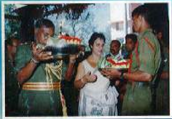
රෙජිමේන්තු අධිපති හා එම මැජිස්ත්‍රා කතරගම දෙවාලය වෙත පුජා වට්ටි පුජා කිරීම.