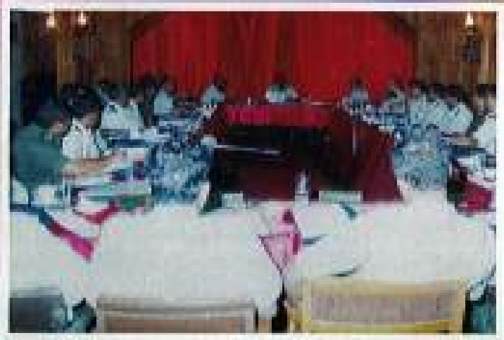
1998.01.20 වන දින රෙජිමේන්තු අධිපතිගේ ප්‍රධානත්වයෙන් රෙජිමේන්තු විධිසන්ධානයේ පැවති 5 වන භයා සහ රැස්වීමේ ශ්‍රී ලංකා වෙණේරු නිලධාරීන් සහ ජිකක අනුදෙක නිලධාරීන් සහභාගී වීම.