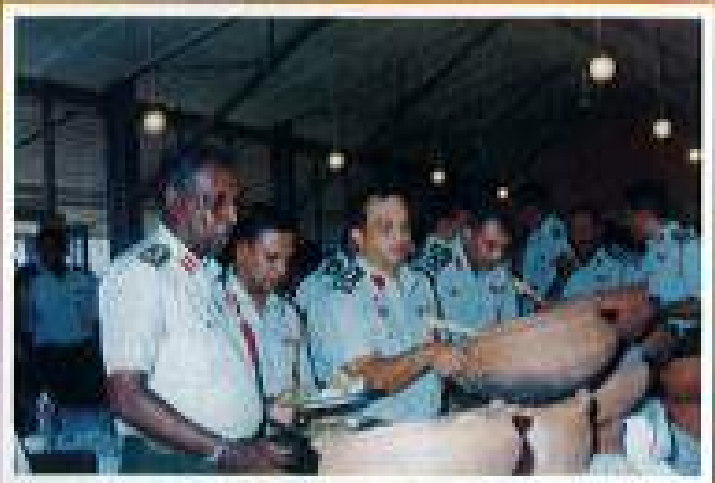
1998.01.20 වන දින රෙජිමේන්තු අධිපතිගේ ප්‍රධානත්වයෙන් පැවති සාතවිලාව නිමාවෙන් පසු ආබාධිත රෝගීන්ගේ සමග දිවා භෝජන සංග්‍රහයට සහභාගී වීම.