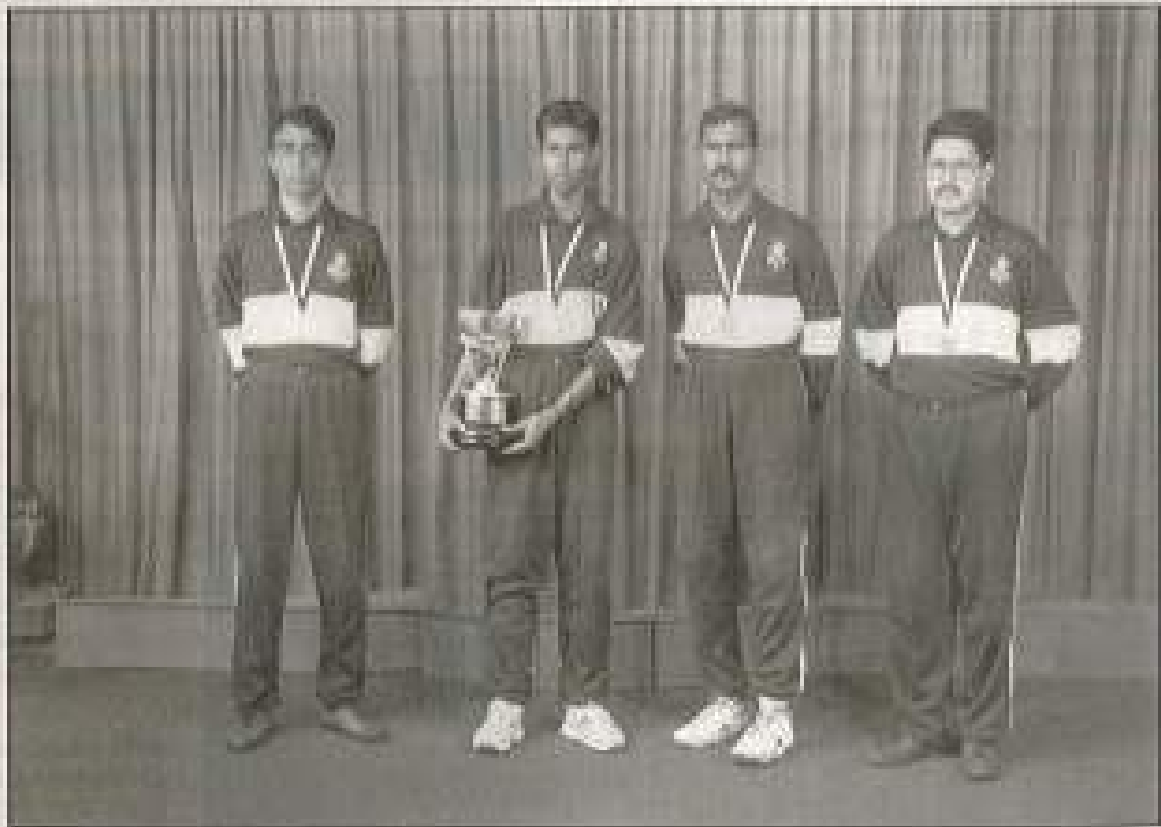
මෙහි සායුදයෙන් දැක්වීමෙන් ප්‍රමිතව පදක්කම් සහ ත්‍රිකුලාන ආකාරයට ඉතාමත් ආරාධනාදායීව සහනාති ටි සායුතයෙන් ප්‍රධානවනුද මෙම ජාතික ක්‍රීඩකයන් වේ

එසේම ආකාරයට ප්‍රමිත ප්‍රවෘත්තියක් පවත්වා ක්‍රීඩා ආකාරයට ක්‍රී ලංකා සායුද හමුදාව සහ සේ සැවීමට ඉතාමත් සහන සඳහන් ක්‍රීඩකයන් සහිතව