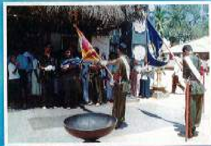
කතරගම දෙවාලය ඉදිරිපිට රෙජිමේන්තු වර්තාවලට හා බිජවලට සෙත් පැහීම.