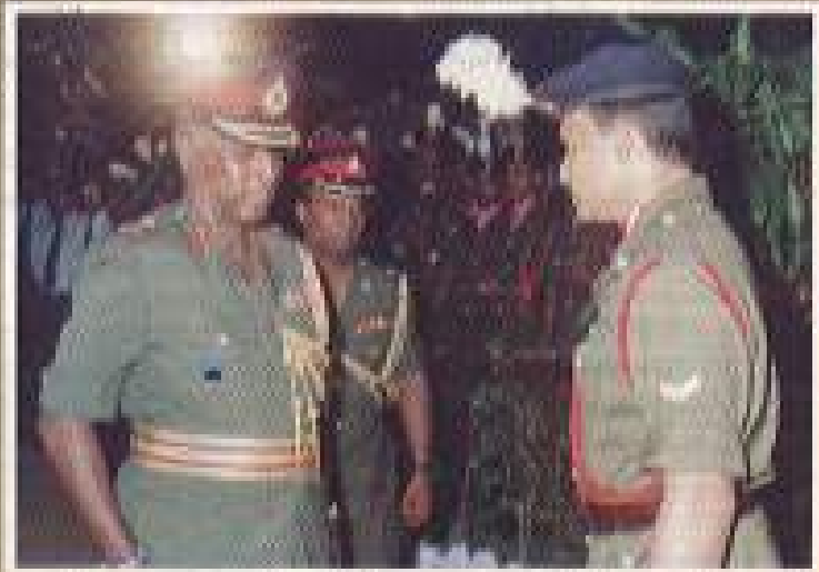
කෝපුල් සමාජ කාලාවේ ආකර්ෂණීය සංග්‍රහයට විසින් රෙජිමේන්තු අධිකාරී හා රෙජිමේන්තු භේදාචාරීයාගෙන් පිළිකරණය.