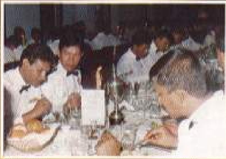
විශේෂ අවස්ථාවකදී පුහුණු කමන්ඩර් ජනරාල් සැරවිල්ලා.