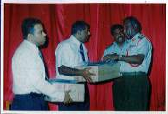
1998.01.20 වන දින ආබාධිත රෝගීන්ගේ වෙනුවෙන් කුරුමුවත්ත සිංහ සමාජය පුහුණනයෙන් සමත් ආරක්ෂක කටවිල 17 ක් පරිත්‍යාග කරන එක් අවස්ථාවක්.