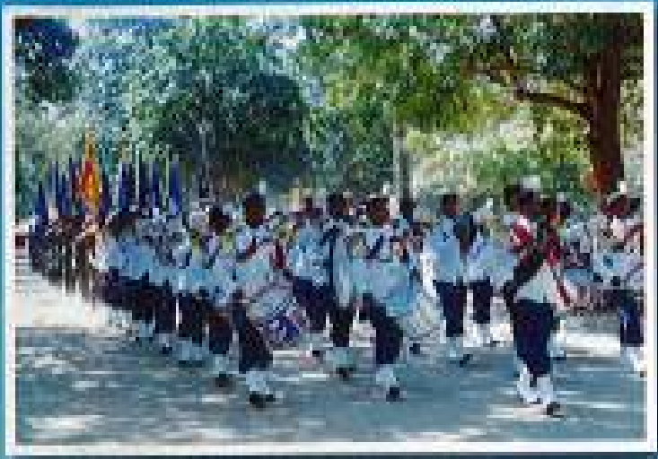
රෙජිමේන්තු ආර්ය වාදක කණ්ඩායම් සමගින් රෙජිමේන්තු වර්තා සහ ඒකක බිජ කතරගම දෙවාලයට රැගෙන එමි.