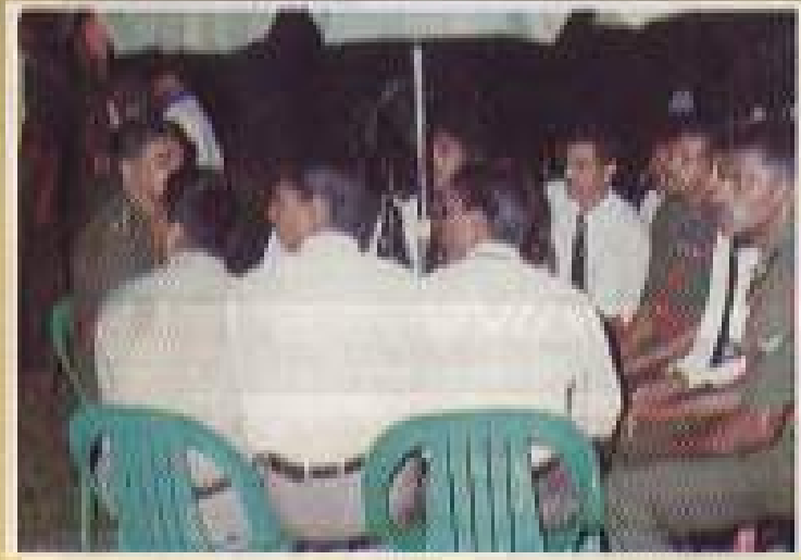
අධිකාරීන් රෙජිමේන්තු සභා ප්‍රසාද පිළිසලාම.