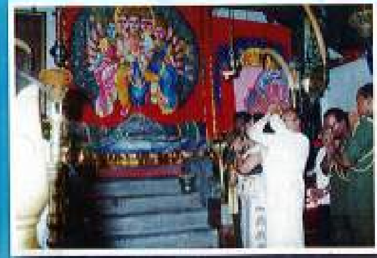
කතරගම දෙවාලය තුළ රෙජිමේන්තු වර්තාවලට හා බිජවලට සෙත් පැහීම.