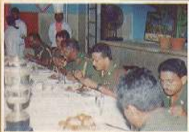
ආදාන ප්‍රස්ථාවෙන්දී භෝජන සංග්‍රහය දිනපති විදින අවස්ථාව.