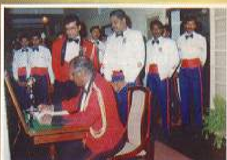
සාදාගැනීමේ රෙජිමේන්තු අධිකාරී ශ්‍රී ලංකා පුහුණු පිළිබඳව අලංකාර කෙටිපෙණක්ලා අධිකාරී පොලොවේ පවත්වාගෙන යාමේ අවස්ථාවක්.