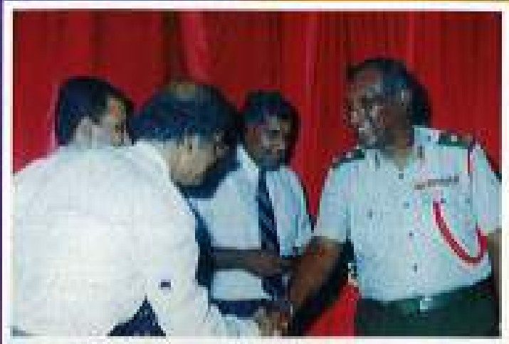
කුරුමුවත්ත සිංහ සමාජයේ ආරාධිත අමුත්තන් වෙනුවෙන් 6 ශ්‍රී ලංකා ජනසය වෙතින් සාදන ලද සිසිලිවත සමරා පලකයක් රෙජිමේන්තු අධිපති විසින් පිටිනමක අයුරු.