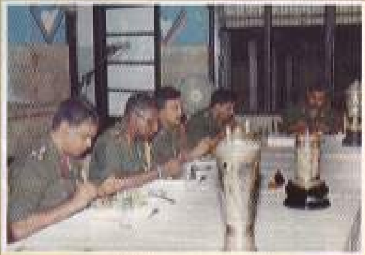
ආදාන ප්‍රස්ථාවෙන්දී භෝජන සංග්‍රහය දිනපති විදින අවස්ථාව.