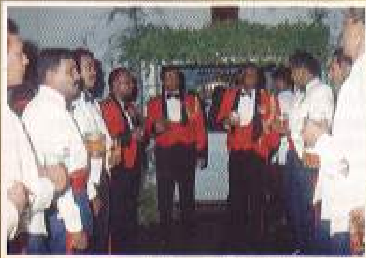
රෙජිමේන්තු මහා/සැර නිවසේ සාදාගැනීමේ චරිත කලා අලංකාර කෙටිපෙණක්ලා අධිකාරී ශ්‍රී ලංකා රෙජිමේන්තු කමන්ඩර් ජනරාල් සැරවිල්ලා.