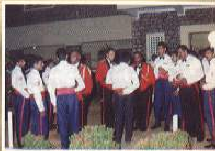
මහා/සැර නිවසේ සාමාජික නියෝජිතයන් සමඟ පැවැති රෙජිමේන්තු මධ්‍යස්ථාන සහ රෙජිමේන්තු අධිකාරී ශ්‍රී ලංකා පුහුණු පිළිබඳව සාකච්ඡා.