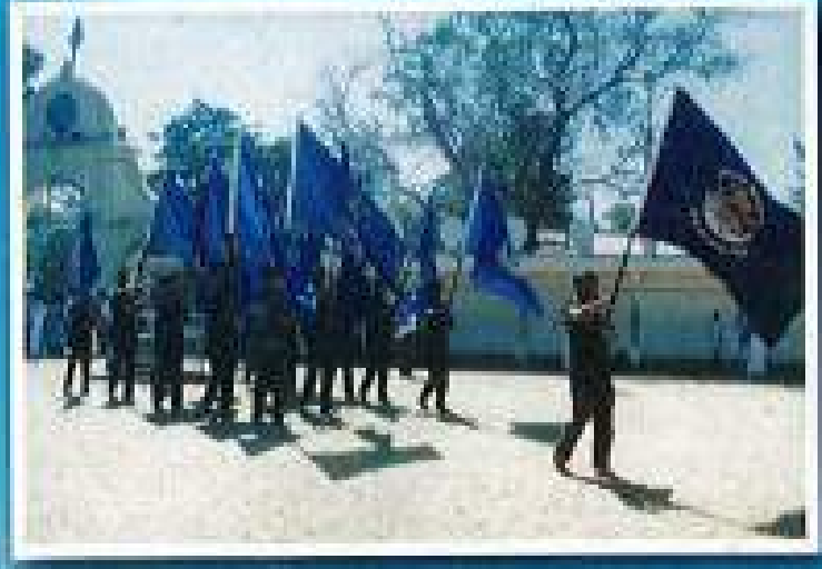
රෙජිමේන්තු වර්තා හා ඒකක වර්තා දෙවාල කුණිගට ඇතුළු වීම.